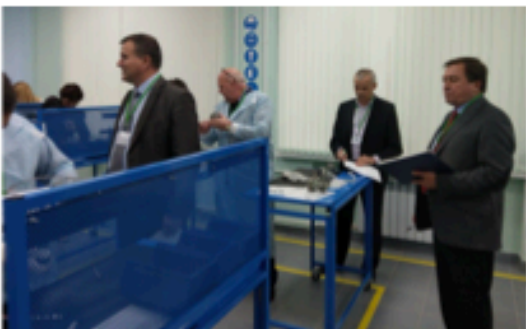
Обучение ректора и управленческой команды вуза