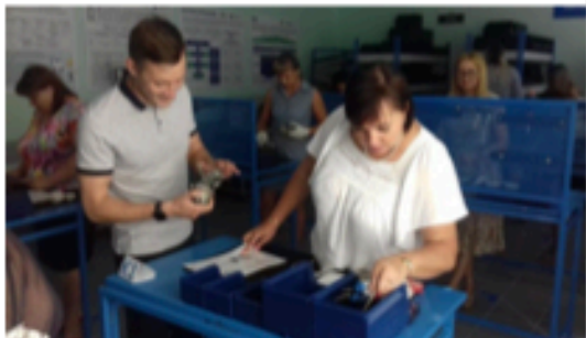
Обучение государственных и муниципальных служащих региона